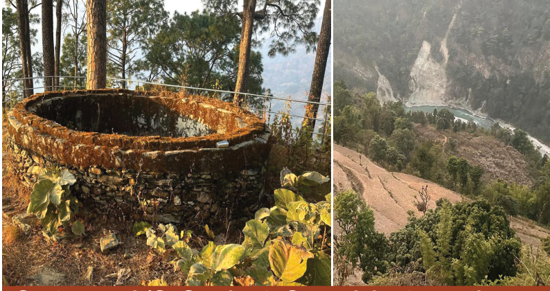
किराती राजाहरूको ऐतिहासिक कोटगढी परिसरमा रहेको पानी जम्मा गर्ने ईनार । दुधकोशी दक्षिण-पूर्वमा अवस्थित बायुङ पुर्खा रुड लगायतले आवाद गरेको राईबारी रावाबेसी-४, धारापानी, खोटाङ

केन्द्रीय कार्यसमिति, काठमाडौं द्वारा प्रकाशित भित्ते पात्रो