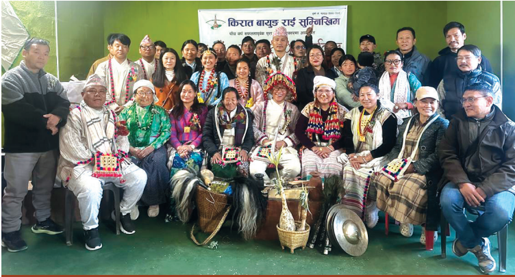
किरात बायुड राई सुम्निखिमको पाँचौं वार्षिकोत्सव कार्यक्रम बालकुमारी काठमाडौं

केन्द्रीय कार्यसमिति, काठमाडौं द्वारा प्रकाशित भित्ते पात्रो