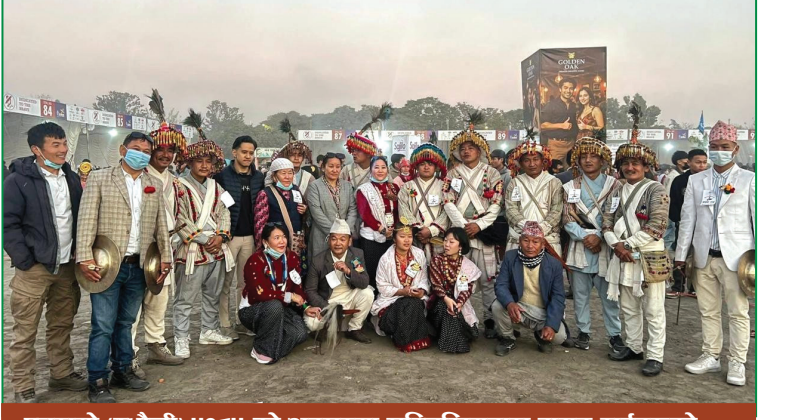
कारामो (उधौली) ५०८५ को अवसरमा सुम्निखिमद्वारा बायुङ राईहरूको हङ सेगो सिली प्रदर्शन दुईखेल, काठमाडौं